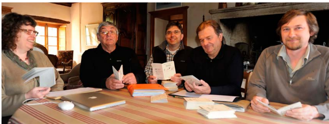
Lancement du carnet de terrain de la Bourgogne Base Fauna, le 22 avril 2010.