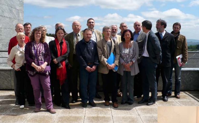
Le 16 mai 2009, signature de la charte de la Bourgogne Base Fauna (BBF) à Bibracte.